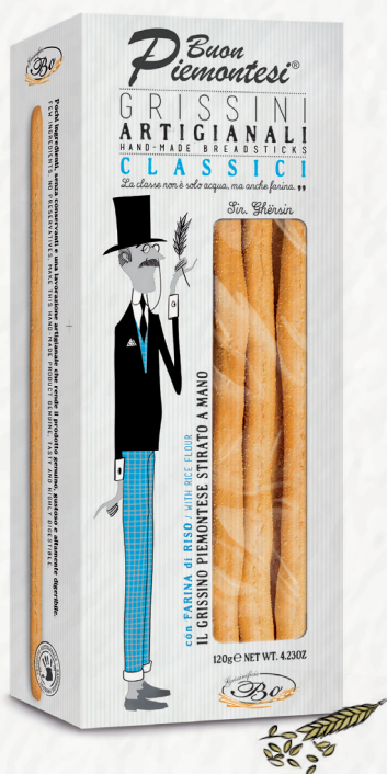
CLASSICI con farina di riso 120g Grissini stirati a mano senza strutto con farina di riso / Handmade breadsticks with rice flour