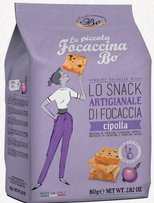
CIPOLLA on olio di riso 80g Snack artigianale di focaccia gusto cipolla con olio di riso / Crunchy focaccia handmade with rice oil, onion