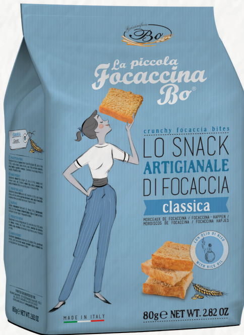
CLASSICA con olio di riso 80g Snack artigianale di focaccia con olio di riso / Crunchy focaccia handmade with rice oil