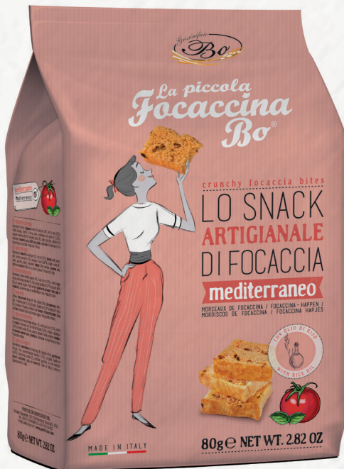
MEDITERRANEO con olio di riso 80g Snack artigianale di focaccia gusto mediterraneo con olio di riso / Crunchy focaccia handmade with rice oil, tomato and oregano