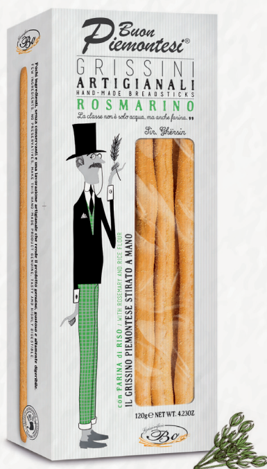
ROSMARINO con farina di riso 120g Grissini stirati a mano con rosmarino, senza strutto con farina di riso / Handmade breadsticks made with rosemary, rice flour