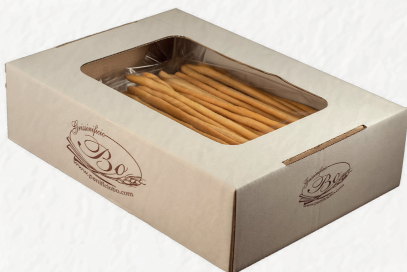
GRISSINI ARTIGIANALI confezione sfusa Grissini stirati a mano in confezione da 1 kg (tutti i gusti) / Handmade breadsticks in 1 kg packs (all varieties)