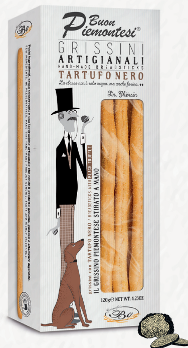
TARTUFO NERO con farina di riso 120g Grissini stirati a mano con tartufo nero, senza strutto con farina di riso / Handmade breadsticks made with black truffle, rice flour