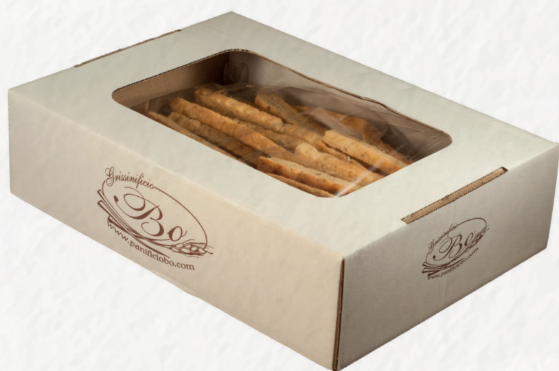
FOCACCINA BO confezione sfusa Strisce di focaccia in confezione da 1 kg (tutti i gusti) / Strips of focaccia in 1 kg packs (all varieties)